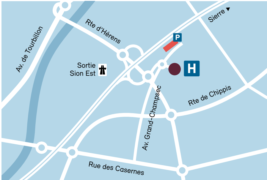
Aula de l'Hôpital du Valais, Av. du Grand-champsec 80, 1950 Sion